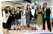
午飯休息時間，因三位體健員向民衆服務