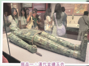
展品一：漢代金縷玉衣

這趟古都之旅將課本知識與實地見聞結合，讓同學對中國文化有了更深刻的體會，讓歷史不再是課本上遙遠的文字，而是觸手可及的真實感悟，引發同學思索如何在現代社會傳承這份深厚的文化瑰寶。