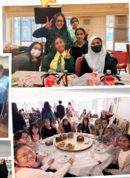
齊齊去「飲茶」，品嚐清真點心