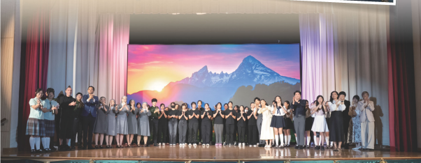
這批全部是與他共舞的！