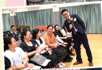
親教與家長互談聆聽者時互動